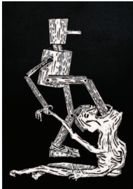
Alle arbeider utført av Cathrine Dahl og Ørjan Aas.

Elevene vil gjennom praktisk skapende arbeid og samarbeidsmetoder få mulighet til å eksperimentere med tresnitt som uttrykk.